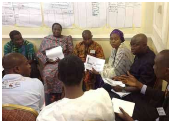
Участники обсуждения оценивают правовую базу Нигерии для СРБ по Контрольному перечню

Поскольку Контрольный перечень сам по себе представляет только вводную информацию по ключевым вопросам, требующим рассмотрения при обзоре национальных правовых баз для СРБ, в дополнение к нему был разработан более подробный Справочник по законодательству и снижению риска бедствий («Справочник»). Справочник предоставляет дальнейшую руководящую информацию о том, как отвечать на вопросы Контрольного перечня путем предоставления обоснования для каждого вопроса, перечень видов законов и нормативных актов, обзор которых необходимо выполнить для предоставления ответов на вопросы, примеры передовой практики из разных стран и комплекс проблемы, которые необходимо учитывать при ответе на каждый вопрос. Кроме того, Справочник также предоставляет данные и руководящую информацию о ведении процесса пересмотра законодательства, основанную на опыте, полученных в ряде стран.